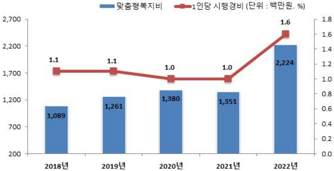
맞춤형복지제도 시행경비 연도별 추이

☞ 맞춤형복지제도 대상 인원 증가와 1인당 맞춤형 복지제도 시행경비 기준액 증가로 지난해보다 맞춤형 복지비가 증가하였습니다.